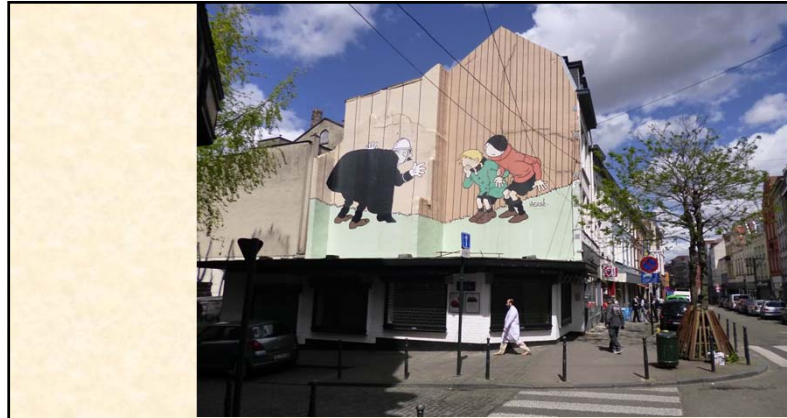
Exemple Brussel·les: pensat pels ciutadans, atreu als turistes.