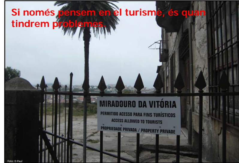
Si només pensem en el turismé, és quan tindrem problemes.